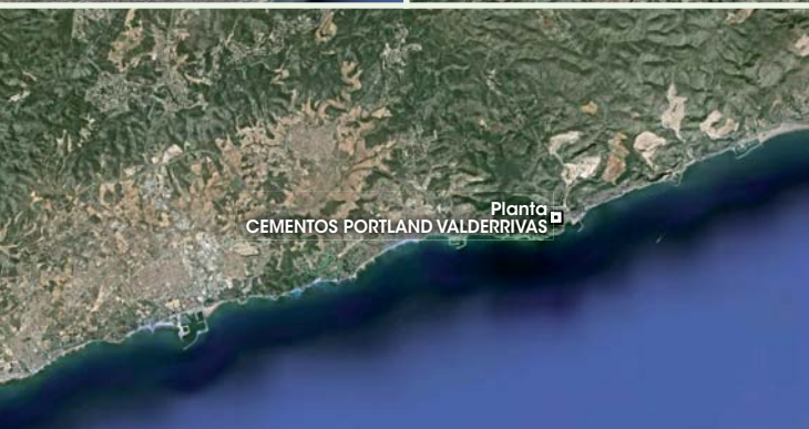
Planta CEMENTOS PORTLAND VALDERRIVAS